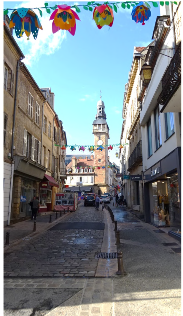
Fig 4 La tour de l'horloge (Beffroi) à Moulins