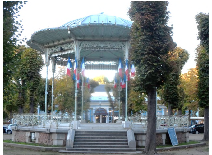
Fig 2 Le Kiosque dans le Parc des Sources à Vichy