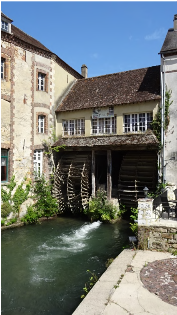
Fig 3 Les roues à aubes au Vieux Moulins Banaux