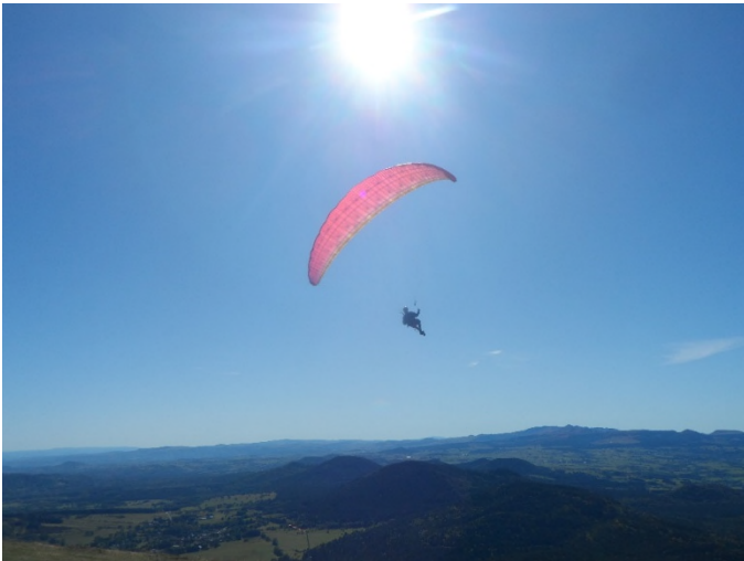
Fig 1 Les parapentistes au sommet du Puy-de-Dôme